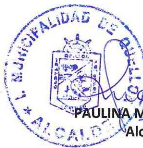
PAULINA MANSILLA NAVARRO Alcalde (S)